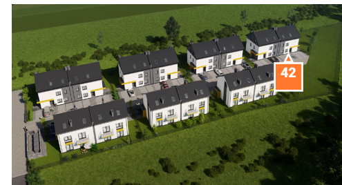
Widok osiedla z lotu ptaka